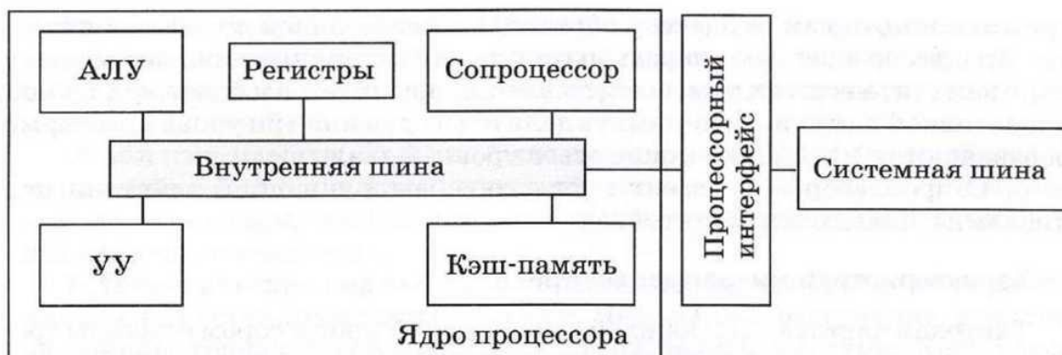
Рис. 2 Схема состава микропроцессора

Центральный процессор — это устройство компьютера, предназначенное для выполнения арифметических и логических операций над данными, а также координации работы всех устройств компьютера.